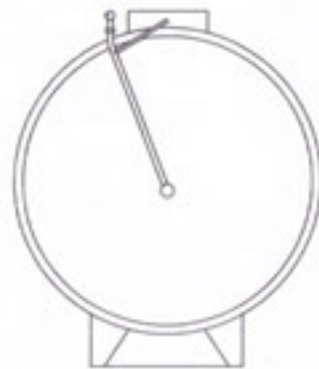
CORTE B - B